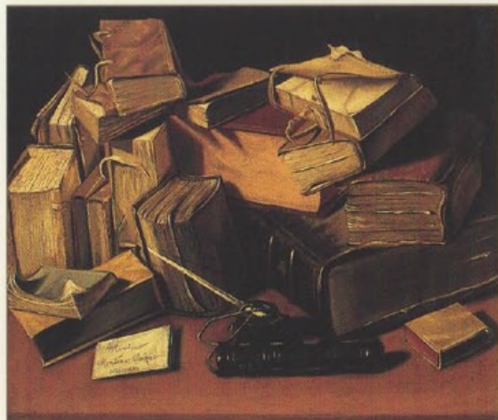
Charles Bizet d'Annonay - Nature morte aux livres - Coll. Musée de Brou, Bourg-en-Bresse

que, quelques siècles plus tard, un Menu de caractère portant son nom inviterait à un voyage dans le temps les gourmets en quête d'émotions gastronomiques et culturelles.