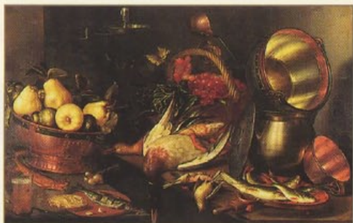
C. J. Van Delft - Nature morte - Musée des Beaux Arts

Édition du xv e Siècle La plus ancienne connue 1