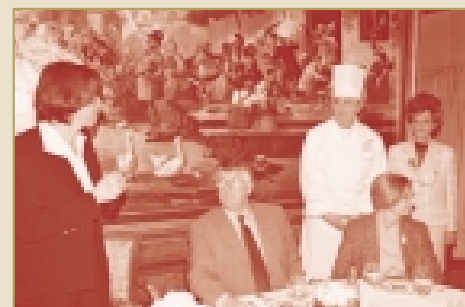
Prise de parole spontanée de Madame le Maire.