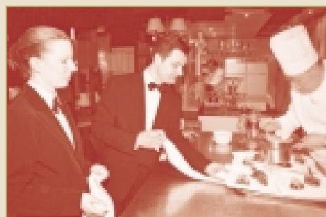
Au buffet, préparation de la dernière petite touche.