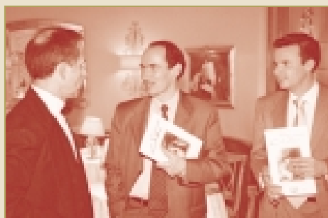
Quand un sommelier du Crocodile rencontre un sommelier de Veuve Clicquot...